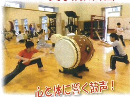
心と体に響く鼓声！